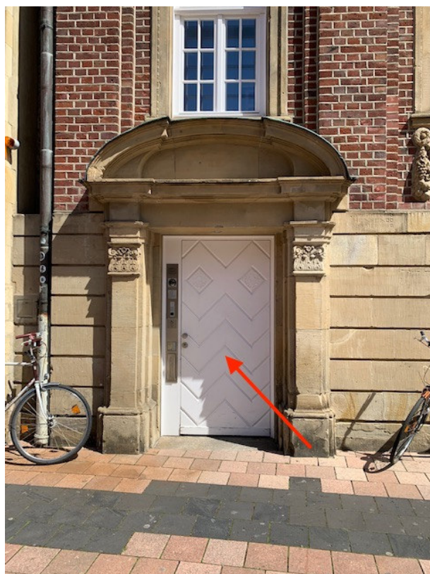
Nebeneingang des Picasso-Museums